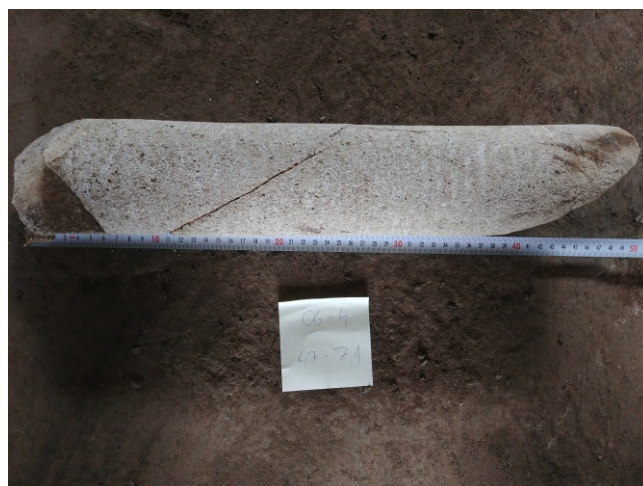
Fot. 3: OG-4 - 6,7 - 7,1 m. p.p.t.