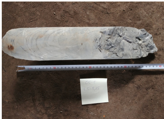
Fot. 1b: OG-1 - 5,5 - 5,85 m. p.p.t.