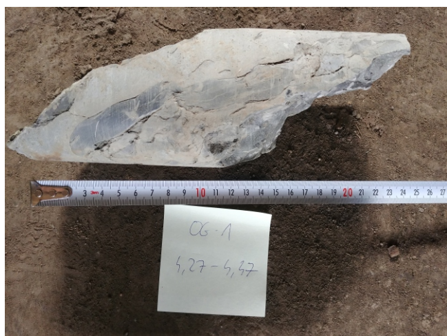
Fot. 5: OG-1 - 4,3 - 4,5 m. p.p.t.

Lustra tektoniczne w łupku ilastym, otwór OG-1, gł. 5,4 - 5,5 m p.p.t