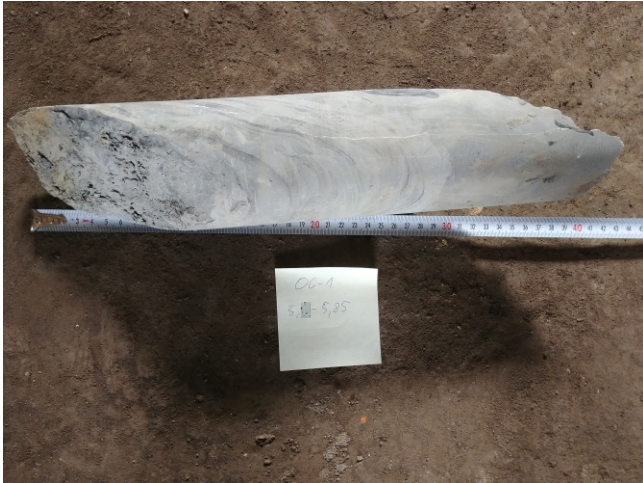
Fot. 1a: OG-1 - 5,6 - 5,85 m. p.p.t.