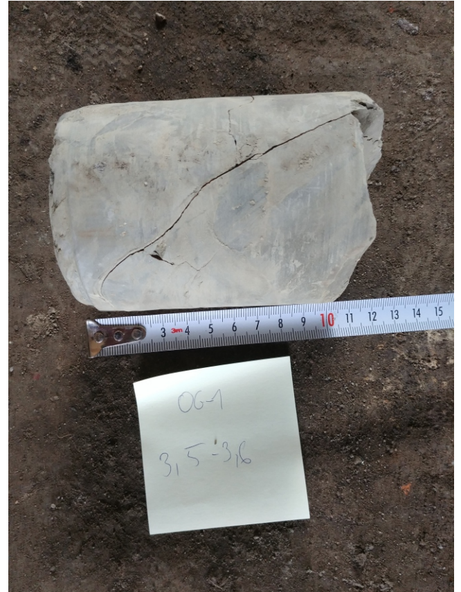
Fot. 2: OG-1 - 3,5 - 3,6 m. p.p.t.