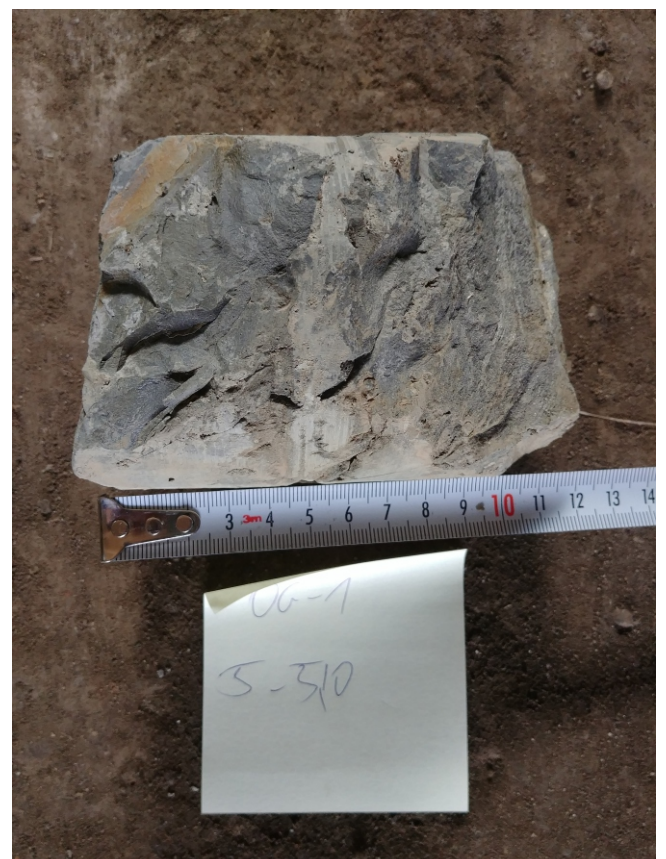
Fot. 4: OG-1 - 5,0 - 5,10 m. p.p.t.